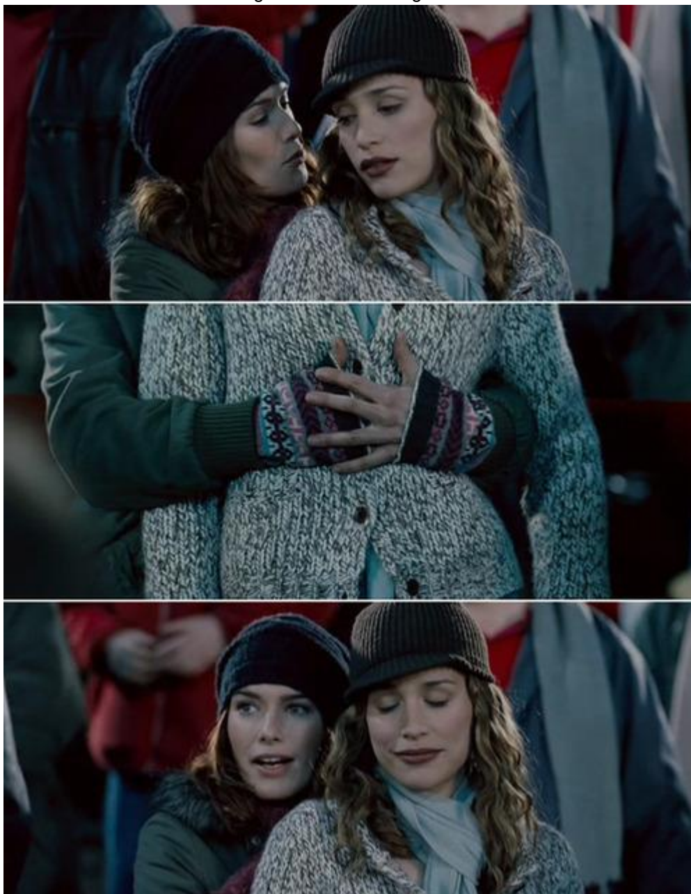
Figura 2 - Cena "Imagine Me and You"