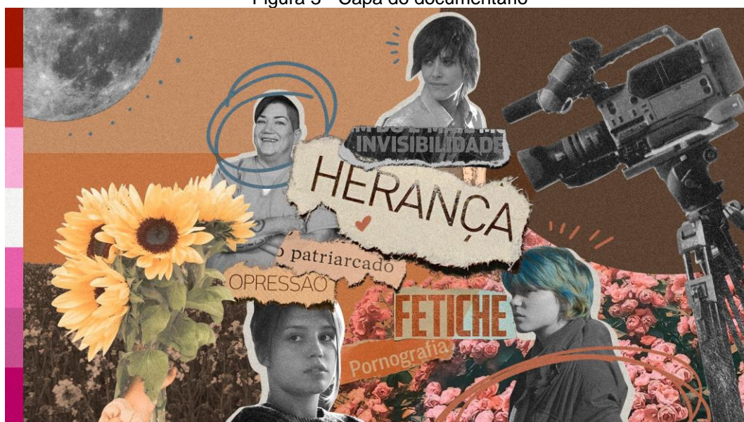
Figura 3 - Capa do documentário

Como as palavras utilizadas foram recortes de jornal, não foi necessário escolher nenhuma fonte para criação da identidade visual.