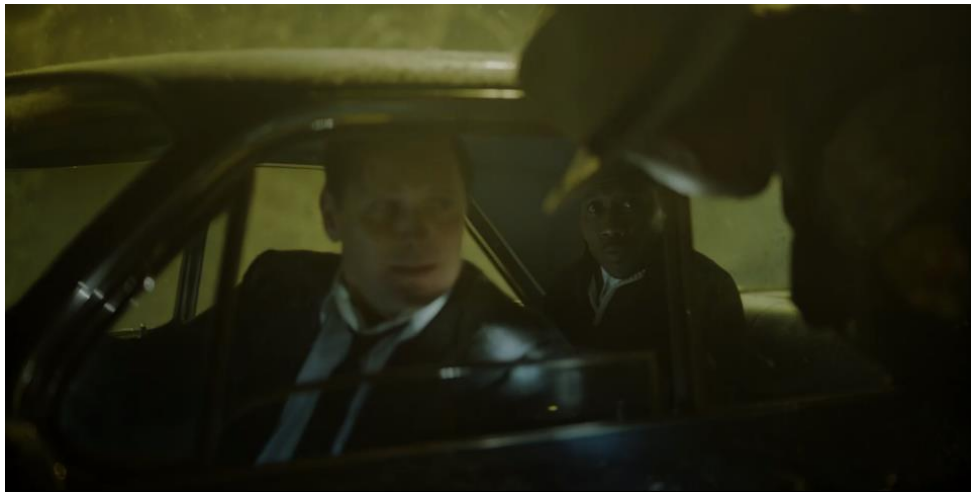
Figura 6 – Policial se Despede