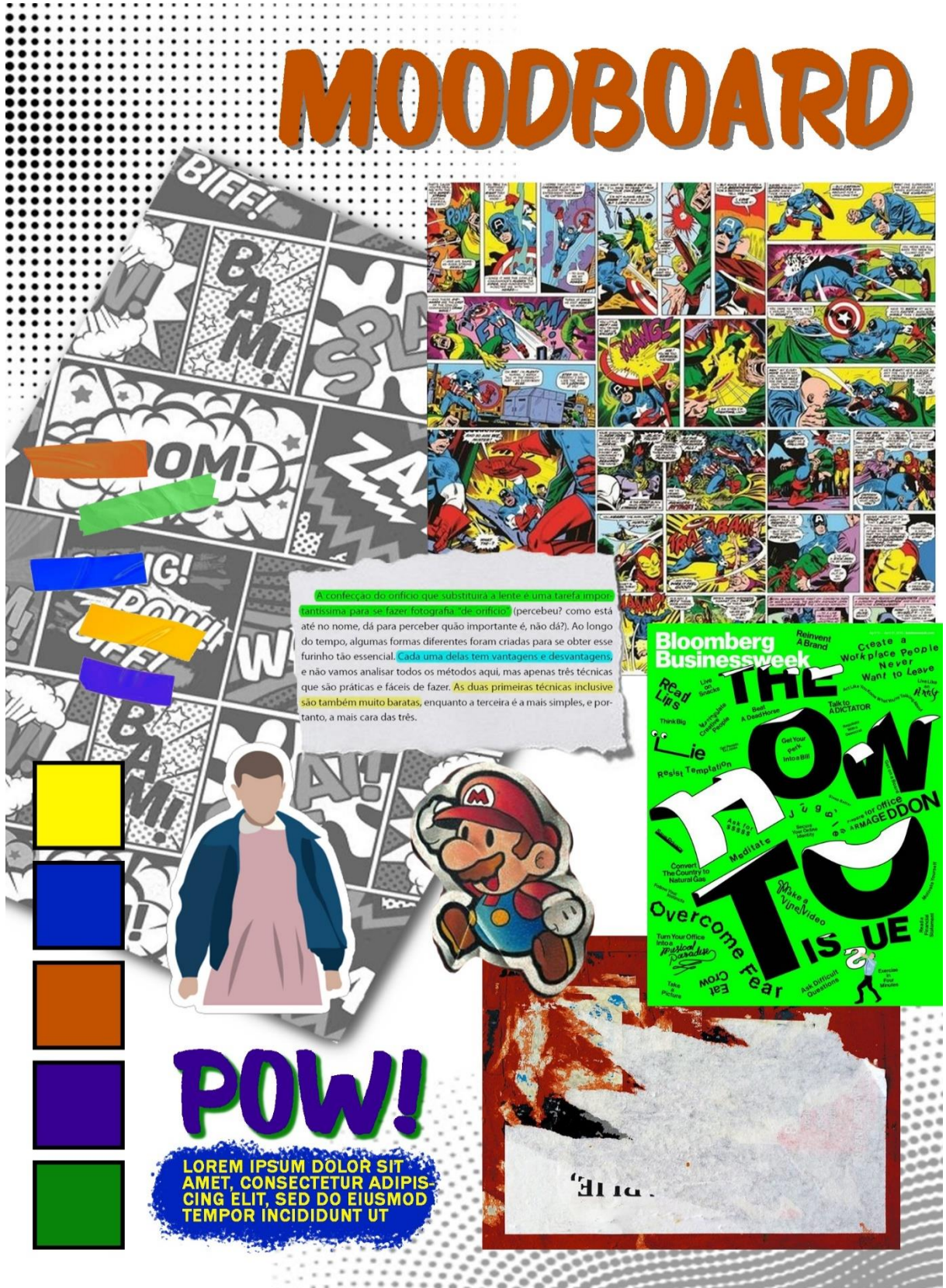
Figura 7 – Moodboard