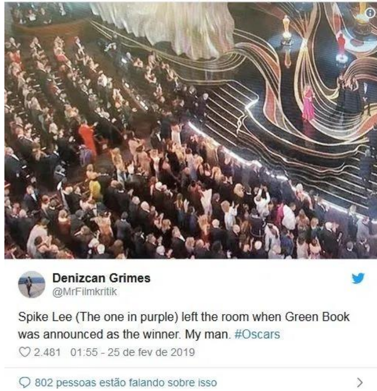
Figura 1 – Spike Lee deixa o Oscar em protesto