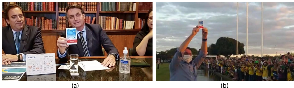
Figura 1: Jair Bolsonaro divulga cloroquina: (a) em live no Palácio da Alvorada em maio de 2020; e (b) para seguidores em julho de 2020