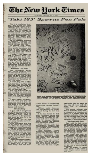
Figura 5 – Artigo do TAKI 183 no New York Times.