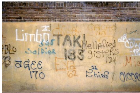
Figura 4 – Tags dos primeiros grafiteiros de New York.

e fora dos veículos urbanos, como trens e metrô, e respectivamente nas suas estações. Com as assinaturas, Demétrius ganhou notoriedade da mídia local, e em 1971 foi publicado uma entrevista sua no jornal The New York Times identificando-se como “Takis 183”, (“Takis” seu pseudônimo e “183” número da rua onde morava). A matéria veiculada no meio de comunicação ganhou grandes proporções o que possibilitou o reconhecimento das inscrições nas paredes e muros da cidade e foi a partir disso que o graffiti foi ganhando adeptos, principalmente jovens, que admiravam a prática como arte, estilo e forma de se expressar (SILVA, 1998 p. 49).