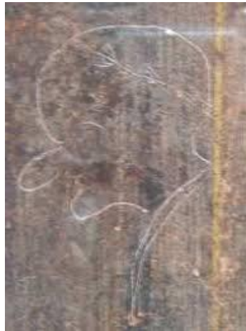
Figura 3 - Caricatura política dos muros de Pompéia.