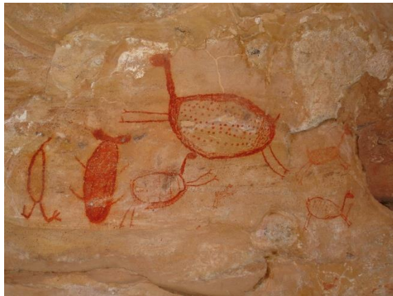
Figura 1 - Pintura Rupestre, Serra da Capivara – Piauí