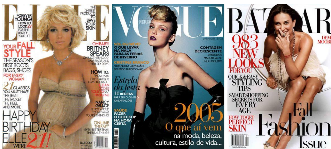
Figura 5 – Capas de revista de 2005