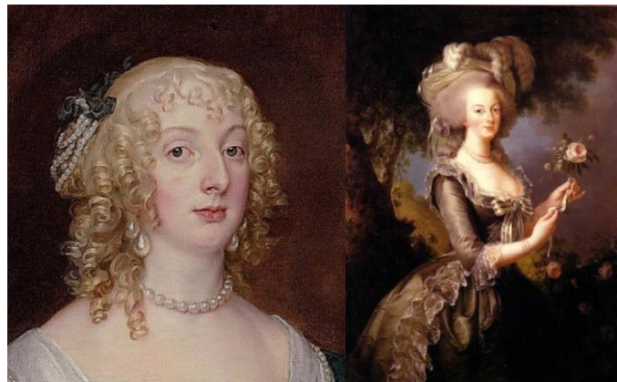
Figura 2 – Quadros de mulheres no período barroco.

O início do movimento Barroco, iniciado por volta de 1600, marcou mais ainda a vaidade. Foi aí onde surgiu a palavra maquiagem. Utilizavam a pele bem branca, as bochechas pintadas com círculos vermelhos e os lábios ruborizados, as perucas claríssimas e as roupas pomposas e exageradas (Figura 2).