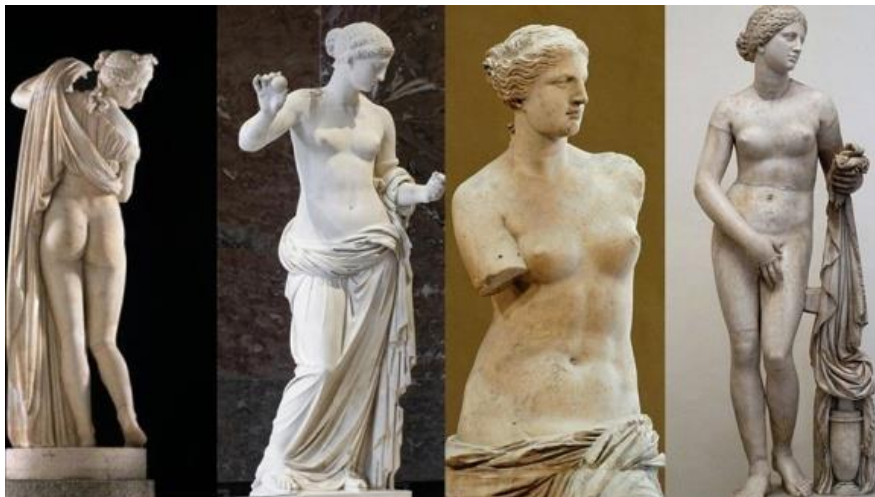
Figura 4 – Esculturas da Grécia Antiga

já que Flor(2009) diz que os padrões de beleza sempre existiram e foram sofrendo modificações de acordo com a passagem do tempo. Na Grécia Antiga, por exemplo, o que era valorizado era o nu (Figura 4), mostrando corpos fortes e bem exercitados, existindo diversas esculturas neste modelo. Na Idade Média (que se deu início no século X e se estendeu até o XV), ao contrário, o padrão era não exibir o corpo por questões religiosas.