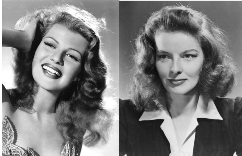
Figura 3 - Rita Hayworth e Katharine Hepburn