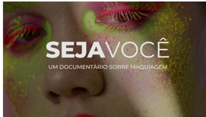
Figura 6 – Tipografia do Documentário

marcas da indústria de cosméticos e da moda. Na escrita, a fonte utilizada contém variações entre “regular” e “bold”, que seria espessura fina ou grossa, para chamar mais atenção e causar maior impacto.