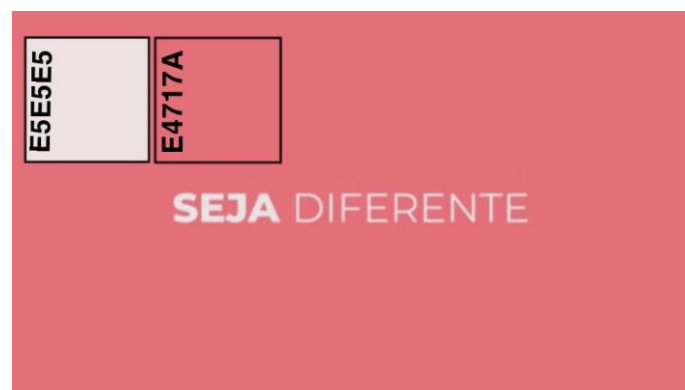
Figura 7 – Paleta de Cores

As cores utilizadas para o documentário foram o branco e rosa (Figura 7). De acordo com a psicologia das cores o rosa tem o papel de esperança, é uma cor que expressa sentimentos quentes, reconfortantes, inspiradores e positivos, o que encaixa com a proposta do documentário que quer trazer para quem assiste uma sensação de personalidade e conforto além de inspiradora. Já branca é associada a luz, inocência e equilíbrio; ele é utilizado para expressar aspectos positivos, além de ter um bom desempenho para o contraste com o rosa escolhido.