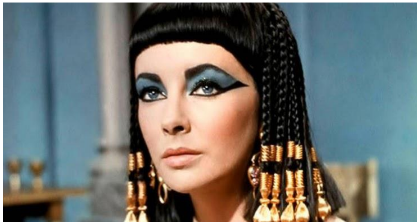
Figura 1 – Representação Cleópatra

A maquiagem possui alguns marcos históricos que são relevantes para o entendimento do que ela se tornou atualmente. Primeiramente Estela Schneider(2010) diz que o uso da maquiagem se deu início no Egito, onde foi encontrados os primeiros testemunhos do uso de cosméticos. Os faraós, por exemplo, utilizavam cores como forma de distinção social, e as mulheres utilizavam os olhos pintados como ponto fundamental, evitando olhar diretamente para Rá, o deus-sol. Não podemos também deixar de falar da Cleópatra (Figura1), que foi uma figura memorável e que utilizava dos artifícios da maquiagem, usando nos olhos um pó chamado Kohl e sua face coberta com argila.