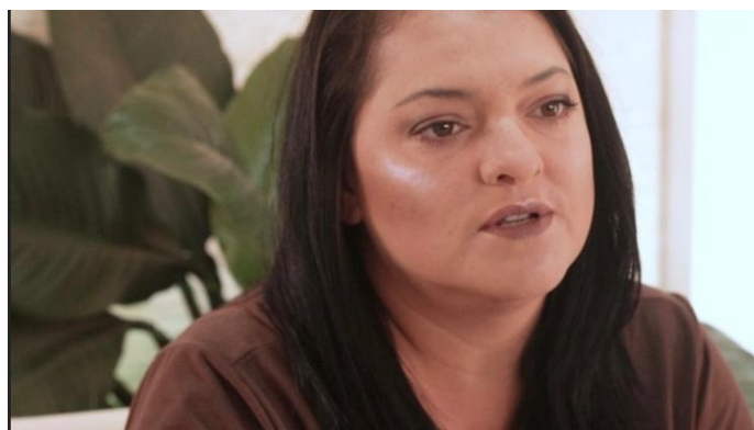
Figura 9 – Exemplo de Enquadramento